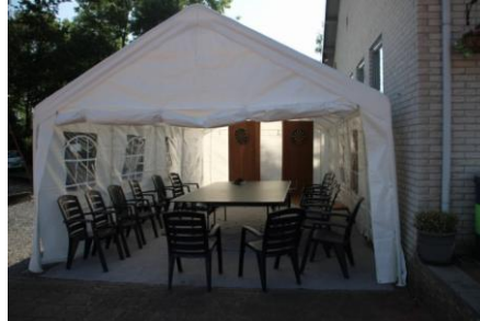
De tent heeft zijn dienst weer bewezen !!