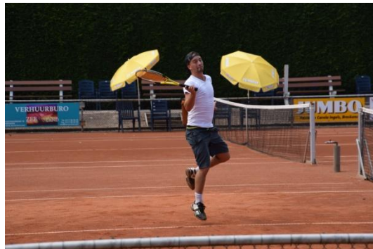
doe eens een dansje