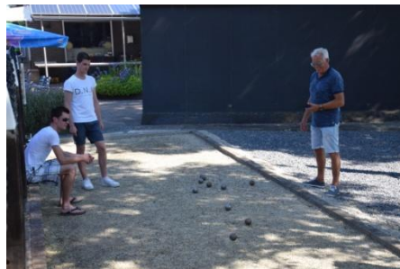
je kunt er ook bij gaan zitten