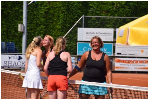
Harderwijk – Breskens 1-0