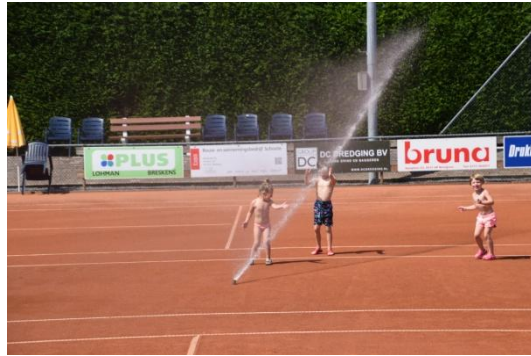
dolle pret voor de kids