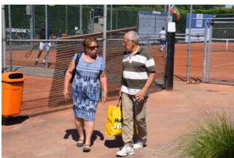
Wat heb jij gedaan gisteren? Ik was op de tennis; oh, ik ook!