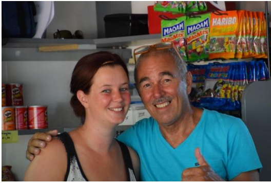
knap stel !