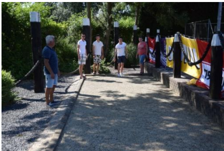
Iets andere ballen