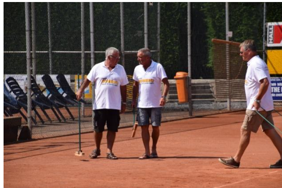
veeg jij of veeg ik?