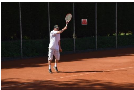
Sla die bal maar eens terug...