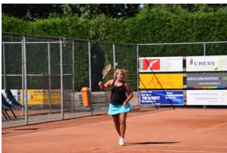
Goed bezig !