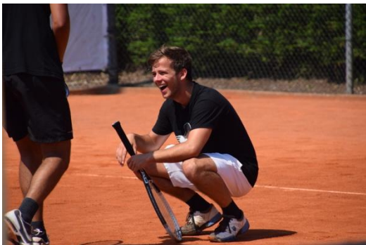
even een onderonsje