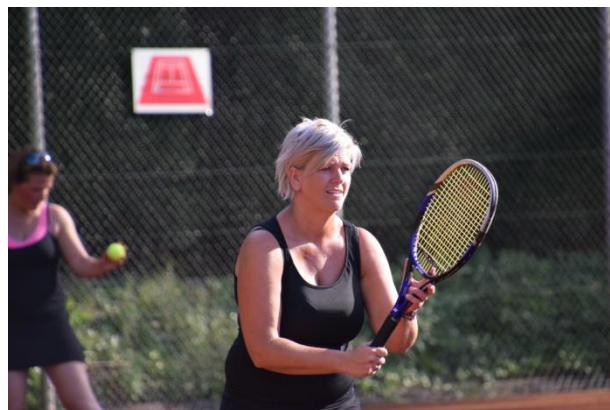
Hendrien onder spanning....