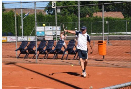
pas de deux